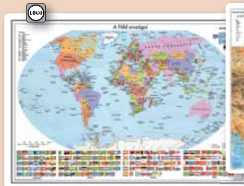
▲ 30907K A Föld országai