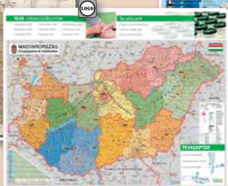
▲ 387827KC Magyarország közigazgatása