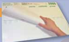
▲ 26 lapos papírkönyöklő

▲ További íróasztali könyöklőink: 30607K Európa domborzata 30807K A Föld domborzata 312103K A magyar államcímertörténete