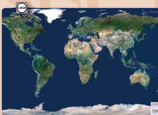
▲ 34016KC Európai unió műholdfotó