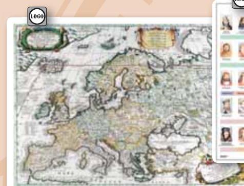
▲ 1435K Antik Európa