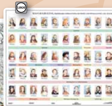
▲ 31227KC Magyar királyok