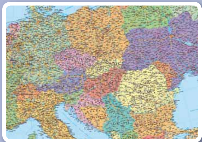
▲ 32706KC Közép-Európa motívummal

Rendezettség. A kemény fóliával bevont alátétek azon kívül, hogy esztétikusak és valódi térképként vagy oktatási segédletként használhatók, egy sor további előnnyel bírnak: védik az asztalt a karcolástól, egyenletes írásfelületet biztosítanak és – mivel vízállóak – akár az étkezőasztalnál is használhatók tányeralátétként.