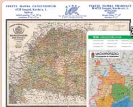
▲ 341223 KC Antik Magyarország