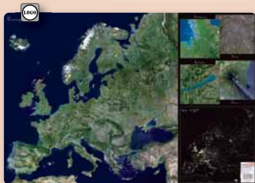
▲ 34016KC Európai unió műholdfotó

▲ További íróasztali könyöklőink: 30607K Európa domborzata 30807K A Föld domborzata 312103K A magyar államcímertörténete