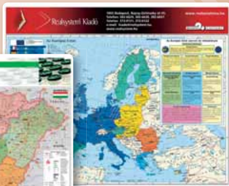
▲ 31707K Európai Unió